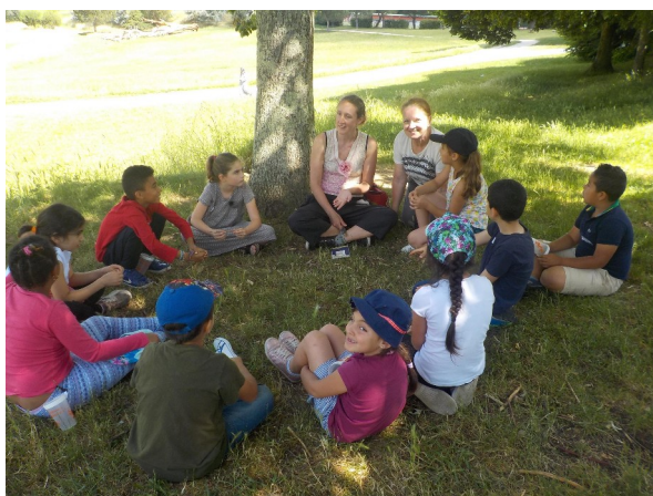
Journées de valorisation Juniors du DD, 2016