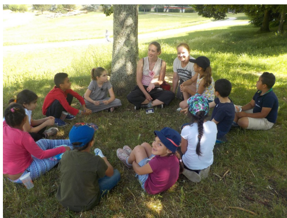
Journées de valorisation Juniors du DD, 2016