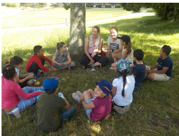
Journées de valorisation Juniors du DD, 2016