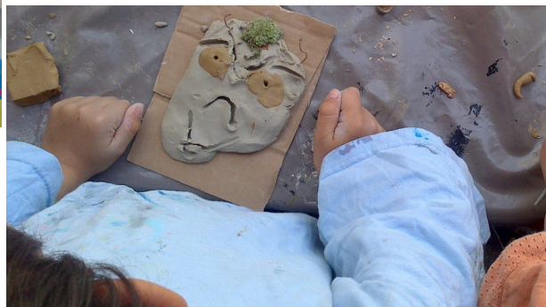
Atelier Philo'Art les émotions, école Hastignan (Saint-Médard-en-Jalles) et Flornoy (Bordeaux)